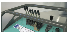
Console de commandes