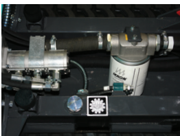
Réservoir d'huile hydraulique incorporé au châssis