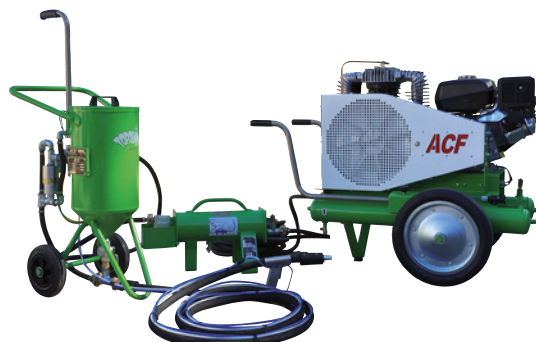
MAXI TOPOLINO 18