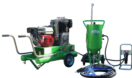
KIT TOPOLINO 18